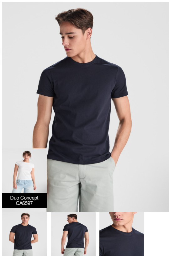
Duo Concept CA6597