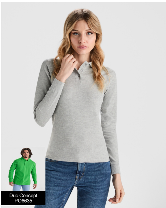
Duo Concept PO6635